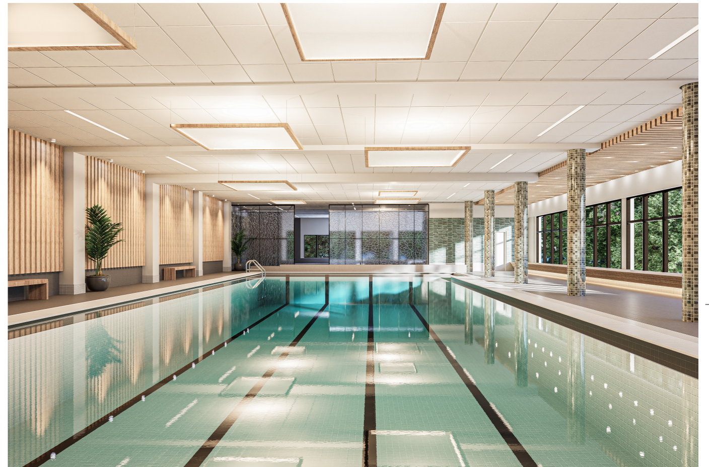
SIMHALL A - DAGBILD