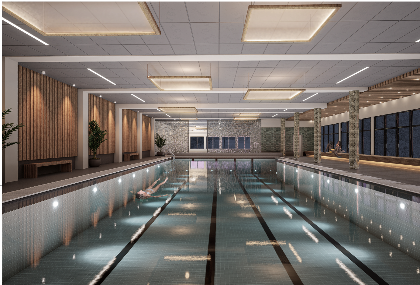
SIMHALL A - KVÄLLSBILD